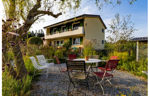
Im Garten des Fluckmättli