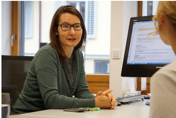
Kompetente Beratung für Ratsuchende aus der Zentralschweiz